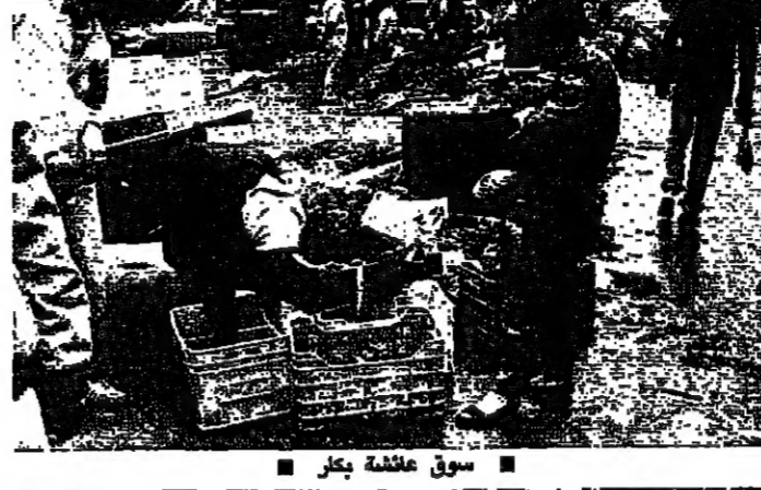
سوق عيشة بكر ■ الحركة في الحمراء